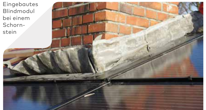
Eingebautes Blindmodul bei einem Schorn- stein