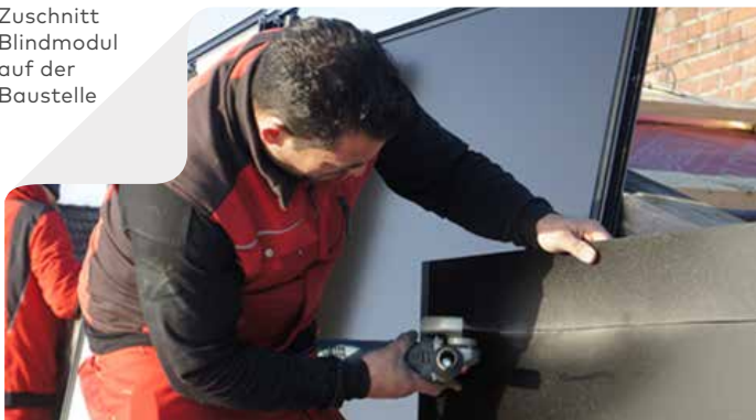
Zuschnitt Blindmodul auf der Baustelle