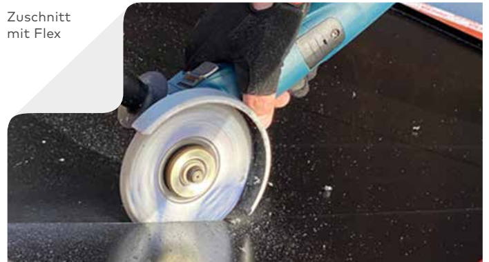
Zuschnitt mit Flex